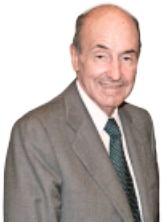
Miquel Roca Junyent Presidente